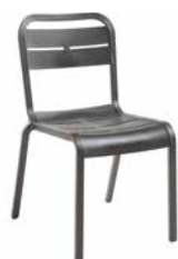
Anthracite U7 601 002