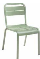
Vert Tender U7 601 736