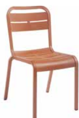
Terracotta U7 601 814