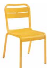
Jaune Indien U7 601 737