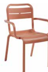
Terracotta U7 701 814