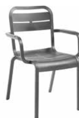
Anthracite U7 701 002