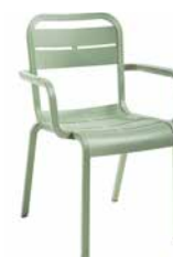
Vert Tender U7 701 736